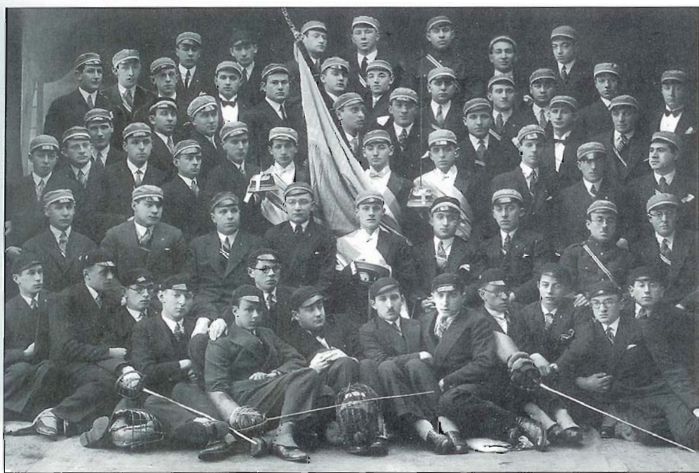
Korporatsioon "Hašmonea" tudengid.

Еврейские актёры после представления на празднике Пурим.