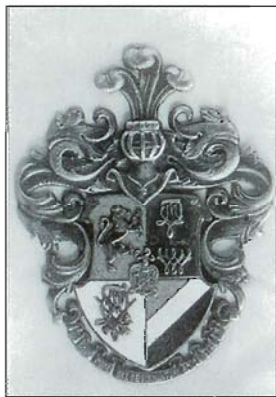
Korporatsioon "Limuvia" vapp. Coat-of-arms of the Limuvia corporation. Герб корпорации "Лимувия"