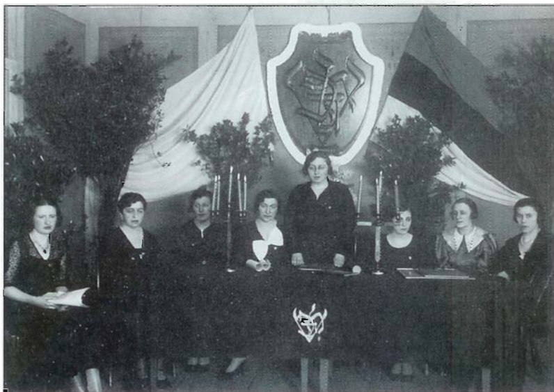
Üliõpilasseltsi "Hazfiro" kuulused tudengineiud. The female students from the Hazfiro student society. В студентческом обществе "Хацфи́ро" состояли девушки-студентки.