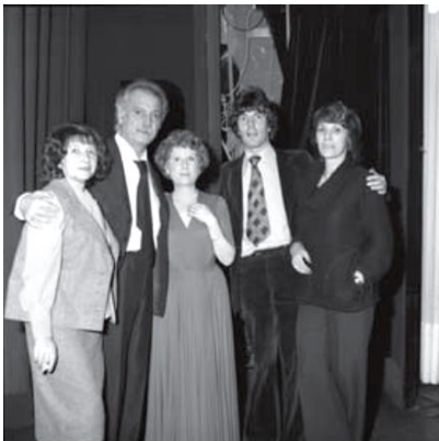
Brassens'i nimi vallutab šansooni maailma.