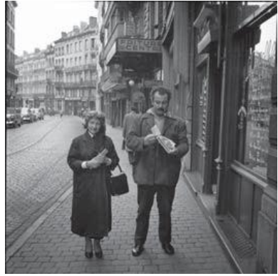
Jalutuskäigul Brüsselis 1954. aastal.