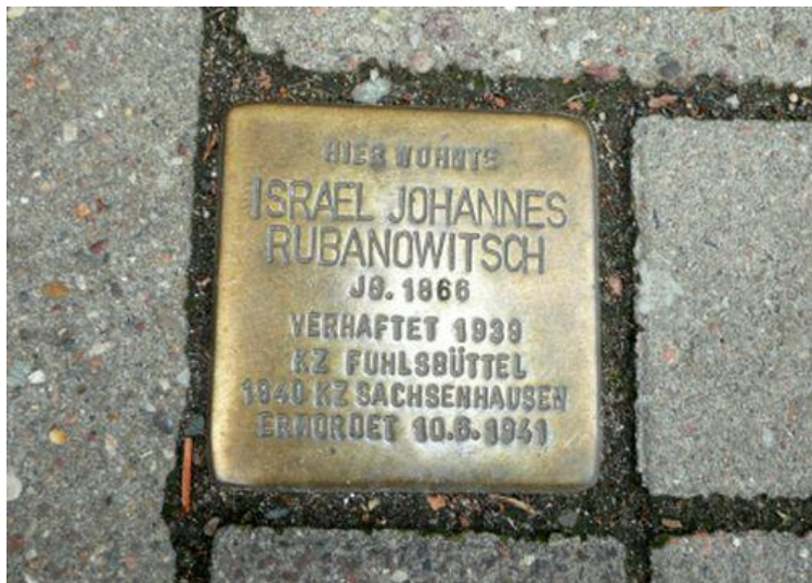
Schulweg 48, Hamburg