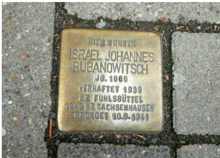
Schulweg 48, Hamburg