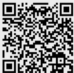
Eestikeelse infotahvli QR-kood