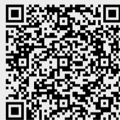
לוח מידע בעברית