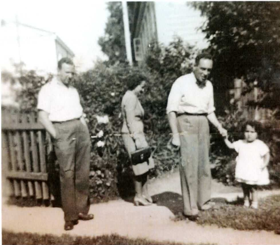
ХЕНЦИ ИНТЕЛИГАТОР И ШЕЙНЕ ЗАНИМИ ЮДЕЙКИНЫ