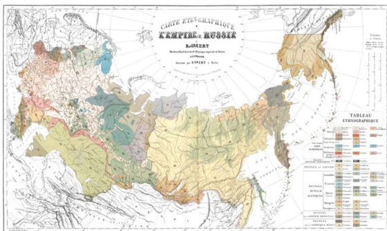
1862, Gustav Fedor Pauli (1817 –1867)